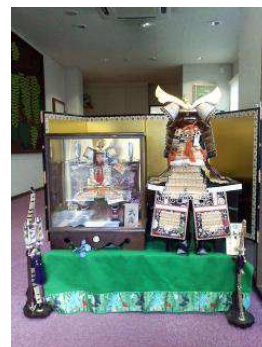
ぶどうのいえ五月人形飾り